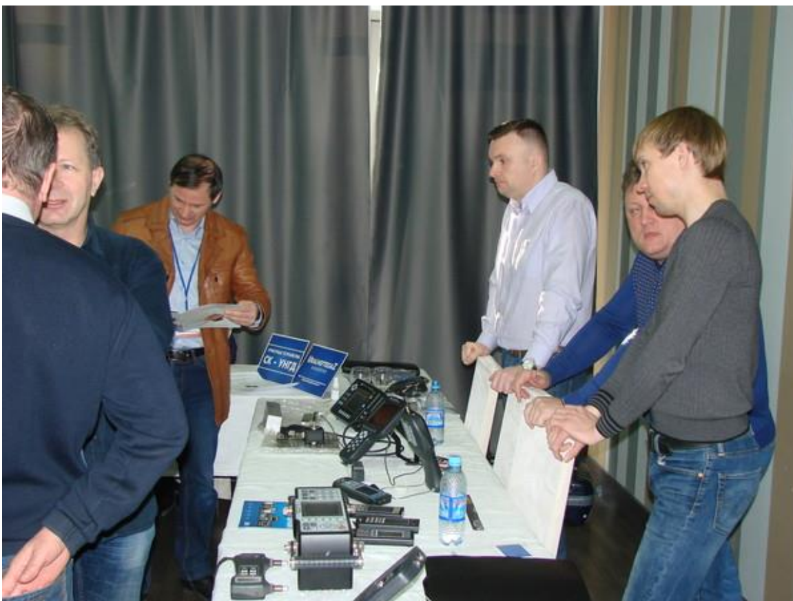
Экспозиция, ООО «Акустические Контрольные Системы» /г.Москва