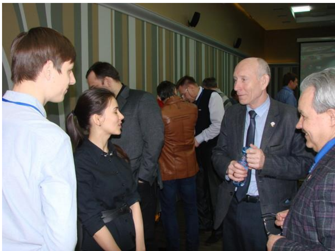
Дискуссии в перерыве